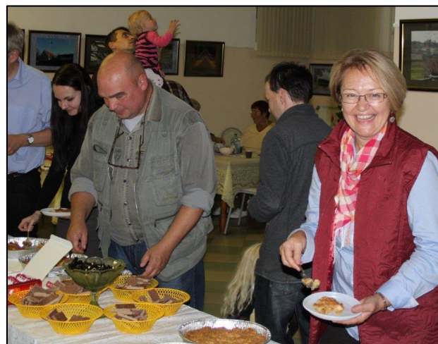
Den svenska äpplepajen var god.

I september 2015 genomfördes en resa med buss från Ljurhalla till Ryazan. En resa som kombinerade turism och personliga möten mellan människor. 35 svenskar från olika håll och sammanhang deltog. Efter en resa över Östersjön, via Helsingfors och Finland, kom man fram till S:t Petersburg. Det blev en hel dags turistanvändning med två svensktalande guider och många stora intryck i Rysslands förra huvudstad. Efter en natts resa i bussen kom man fram till Ryazan som ändå var resans huvudmål.